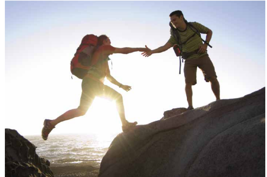
Schließen Sie die Lücke – der Staat und Ihr Arbeitgeber helfen Ihnen dabei!